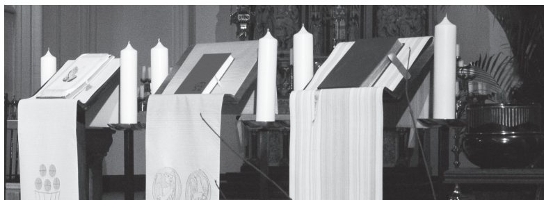
drie ambo's voor de eerste, tweede en derde lezing