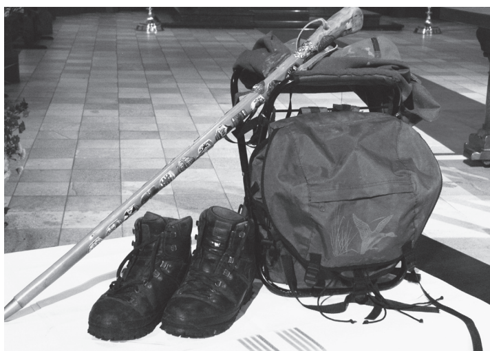
symbool bij de viering op de 3-e zondag van de Advent in het C-jaar